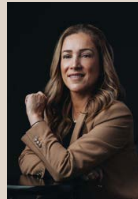
Autora: Fabricia Koplin

Além das funções preventiva e preditiva, a Advocacia Empresarial Integrativa exerce papel prescritivo, com a finalidade de orientar critérios, alçadas e parâmetros jurídicos que subsidiariam escolhas recorrentes do negócio. No plano contencioso este papel estrutura soluções juridicamente orientadas para o conflito, definindo estratégias processuais, consensuais ou híbridas mais aderentes ao contexto organizacional, ao apetite de risco e aos impactos econômicos, reputacionais e institucionais envolvidos.