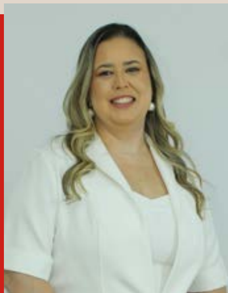
Autora: Erika de Mello

É nesse ponto que a Advocacia Empresarial Integrativa se torna relevante. Por que determinados riscos e conflitos se repetem dentro das organizações, mesmo quando “a lei é cumprida” no papel? Em geral, a resposta não está em um ponto isolado, mas na forma como a empresa decide e opera cultura, processos decisórios, incentivos, comunicação, estilos de liderança e a maneira como pessoas, áreas e demais stakeholders interagem.